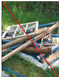
Nej tak til byggeaffald

Fejlsorteret storskrald og haveaffald. Læs mere i teksten om, hvilket affald vi tager med, og hvordan det skal stilles ud