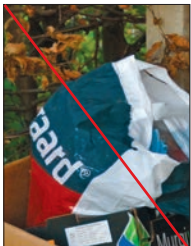
Kun klare sække