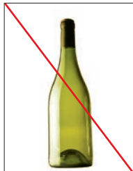
Nej tak til glas og flasker