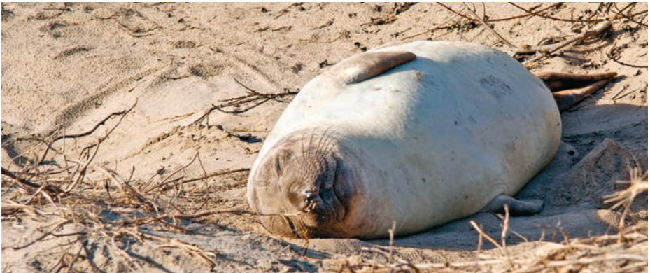
Kigge - ikke røre! Sæler kan dø af influenza, som kan smitte mennesker.

www.odsherred.dk søg på "påkørte dyr", "døde dyr på stranden" eller "tilskadekommet vildt"