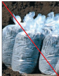
Ingen haveaffald i plast-sække