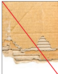
Pap skal i sække eller bundtes